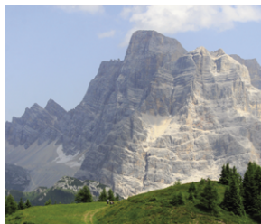
Pelmo, Croda da Lago