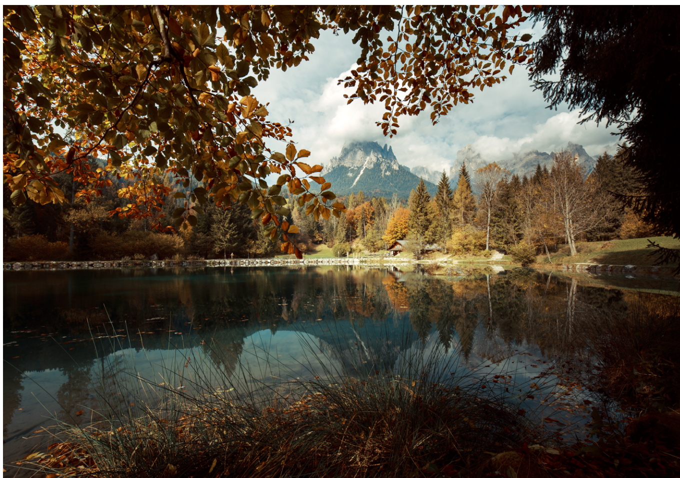
Pale di San Martino - Archivio apt San Martino di Castrozza, Passo Rolle, Primiero e Vanoi - Laghetto Welsperg in autunno - ph Ronald Jansen

ore 15.30 Conclusioni. Il ruolo delle amministrazioni locali e delle comunità per il futuro delle Dolomiti